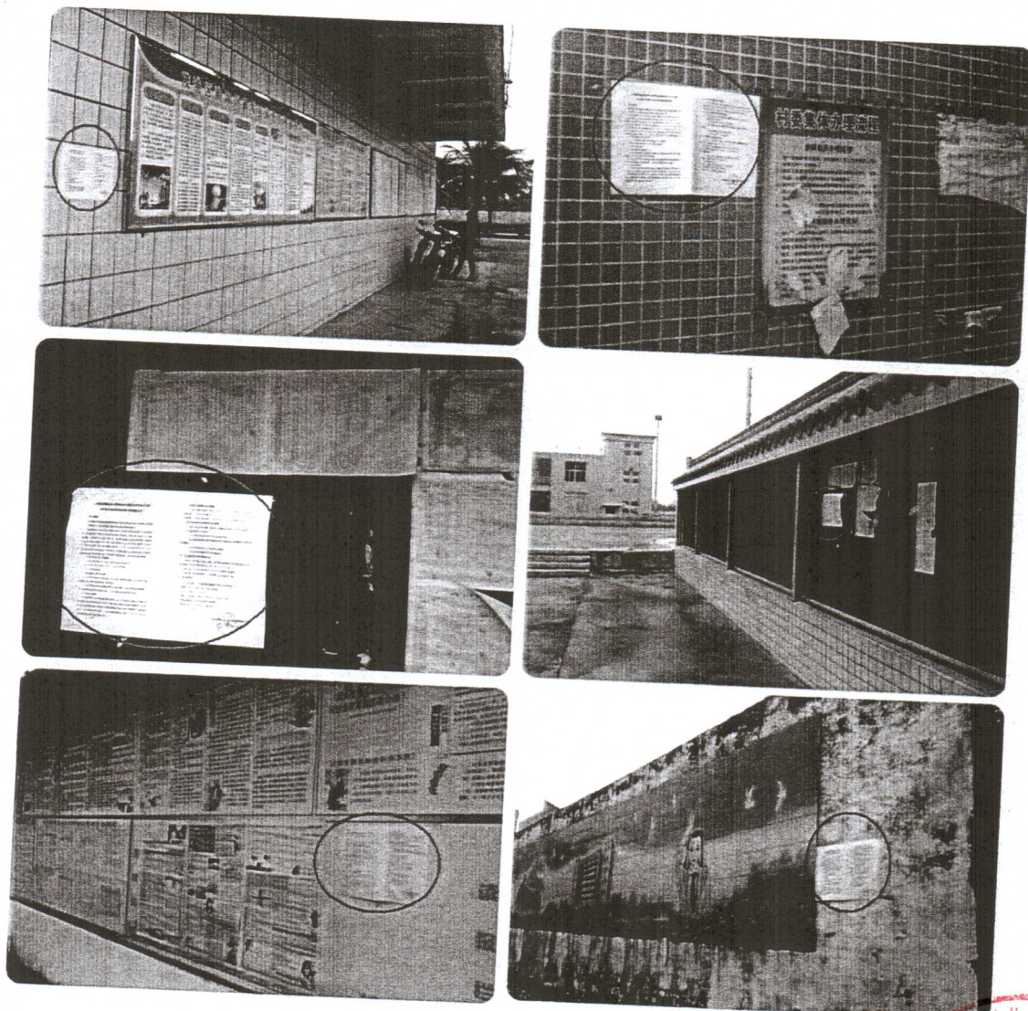
图 11.2-4 公众参与公告现场张贴照片